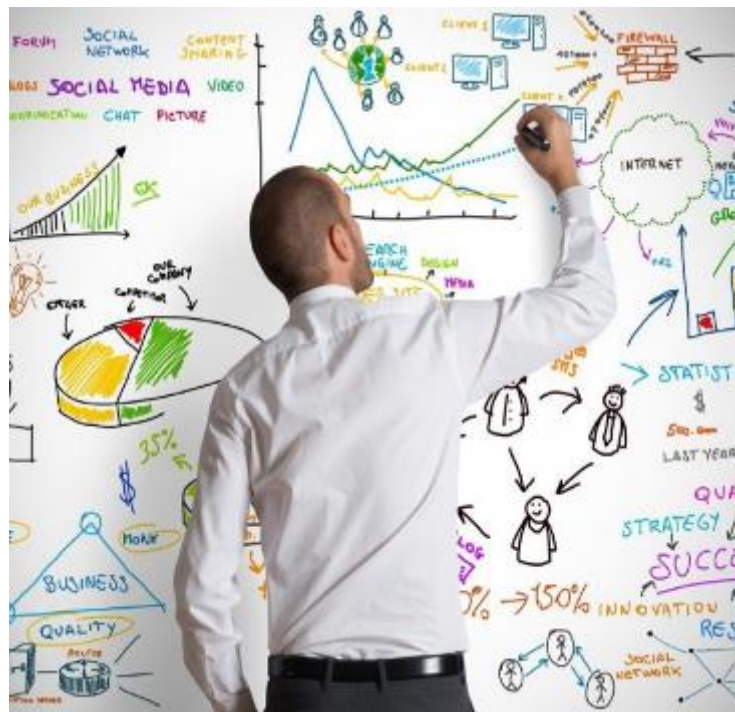
Programma's & Projecten